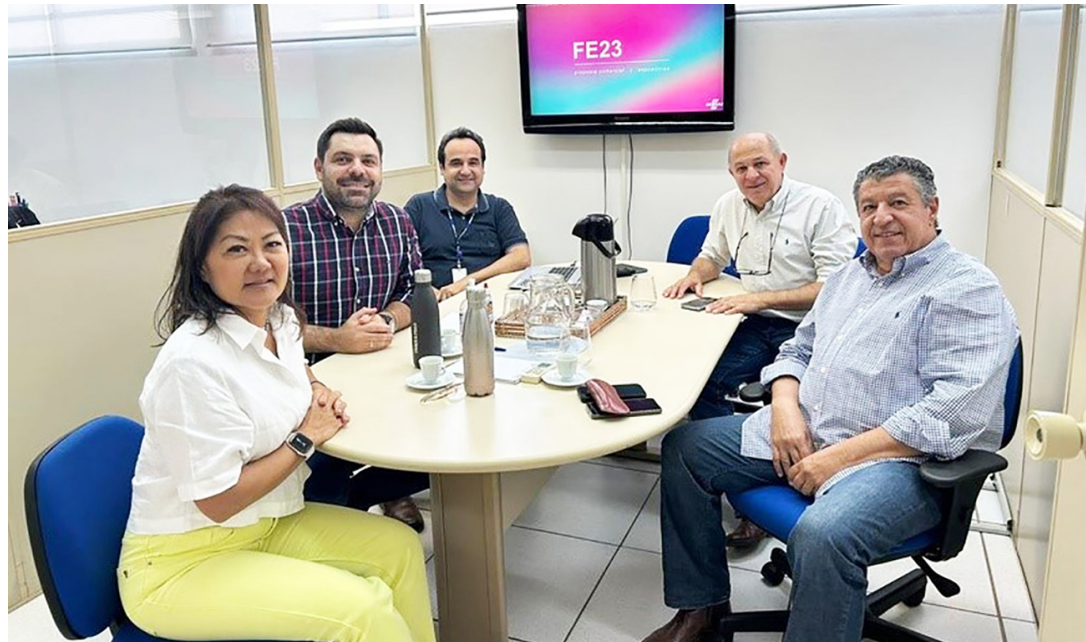
ENCONTRO: Dirigentes de Os Independentes com representantes do escritório regional do Sebrae

Com o objetivo de qualificar ainda mais os colaboradores do Parque do Peão, a diretoria Os Independentes definiu convênio no qual a Faculdade Sebrae ofertará cursos com descontos especiais para membros e funcionários da associação.