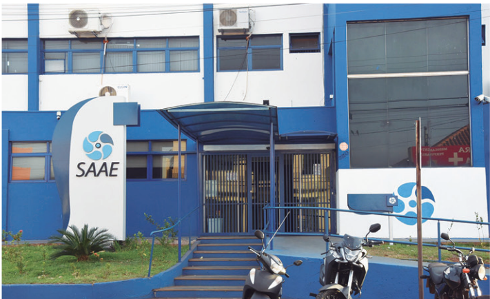
SAAE: Informações sobre despesas constam em projeto orçamentário

O orçamento da autarquia de 2026 prevê também que serão gastos R$ 1.640.000,00 com o pagamento de juros e encargos da dívida; R$ 64.454.000,00 para outras despesas correntes; R$ 4.725.000,00