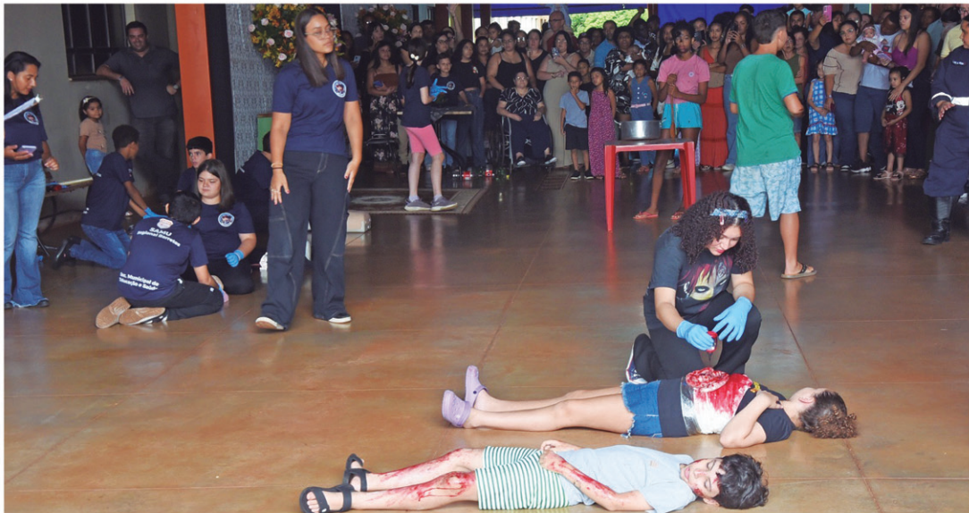
PROJETO: Atividades foram realizadas com encenações sobre situações de emergência

A terceira turma do projeto "Samuzinho" formou 50 estudantes do 5º ano de escolas da rede municipal e das particulares Nomelini Cirandinha, Liceu e Colégio Barretos. A iniciativa é do Núcleo de Educação em Urgência - ligado ao Serviço de Atendimento Móvel de Urgência (SAMU 192) - e tem como finalidade instruir os participantes sobre medidas de primeiros socorros a serem adotadas em situações de urgência e emergência e para que utilizem de forma consciente a central telefônica de emergência 192.