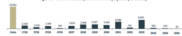
Figura 10 – Fluxo de Amortização da Dívida em 31/12/2025 (R$ milhões)

A posição de caixa da Companhia encerrou o 4T25 em R$ 15,0 bilhões, nível suficiente para atender ao cronograma de amortização da dívida até 2029, em linha com a gestão conservadora da caixa da Minerva Foods. Em 31 de dezembro de 2025, cerca de 68% da dívida bruta estava atrelada a dívidas em moeda americana e, em consonância com a nossa política, atualmente a Companhia mantém hedged , no mínimo, 50% de sua exposição cambial de longo prazo, buscando proteger o nosso balanço com a disciplina financeira. A alavancagem líquida, medida pela relação Dívida Líquida/EBITDA dos últimos 12 meses encerrou o 4T25 em 2,6x. Mesmo após a distribuição de dividendos antecipados no montante de R$ 162,1 milhões em dezembro de 2025. Ainda, nesse 4T25, ocorreu o exercício de 318.398 bônus de subscrição, perfazendo um montante de R$ 1,6 milhão. Vale ressaltar que restam ainda 187,0 milhões de bônus de subscrição no mercado, representando R$ 936,1 milhões, e que devem beneficiar o caixa da Companhia ao longo dos próximos anos.