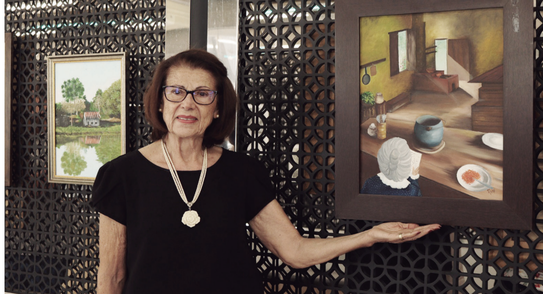
ARTE: Rute apresenta 40 quadros na mostra que é aberta ao público

A exposição “Mãos que Pintam o Tempo - Edição 2”, da artista plástica Rute Meneghelo, é atração na biblioteca do Unifeb até o final do mês. A mostra apresenta 40 obras e é organizada pelo Núcleo de Apoio Cultural (NAC) do centro universitário. A visitação pode ser feita de segunda a sexta-feira, das 9 às 22 horas, sendo aberta à comunidade acadêmica e ao público em geral.