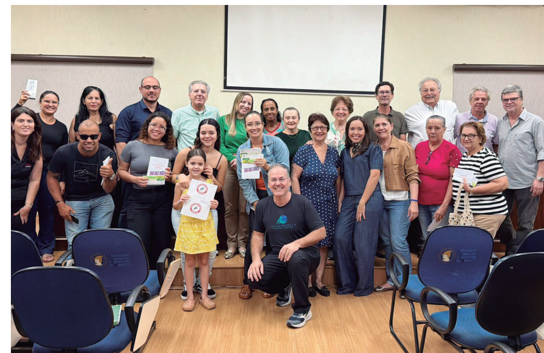
PREMIAÇÃO: Consumidores, lojistas e representantes das entidades do comércio

A Associação Comercial e Industrial de Barretos (ACIB) e o Sindicato do Comércio Varejista (Sincomercio) realizaram a entrega oficial dos prêmios da campanha do Dia das Mães. Dirigentes das entidades e o vice-prefeito Mussa Calil Neto participaram do ato. "Tive-