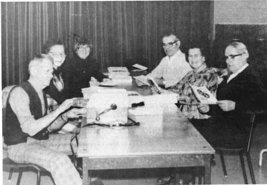
AUS UNSERER KLUBARBEIT: DIE NACHRICHTEN-HELFER