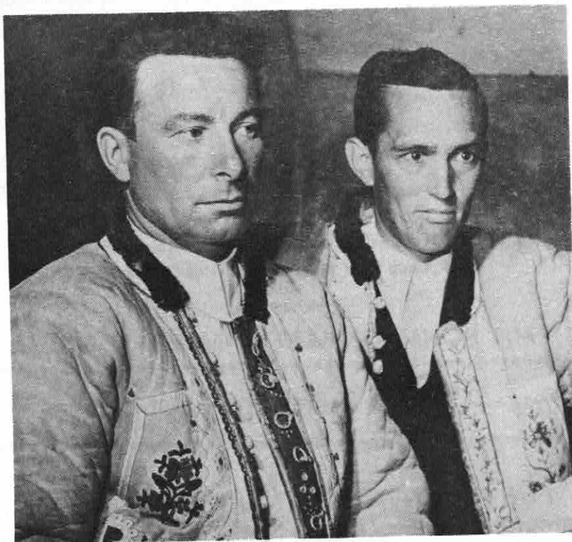
"Antlitz der Heimat" (Girlsau)