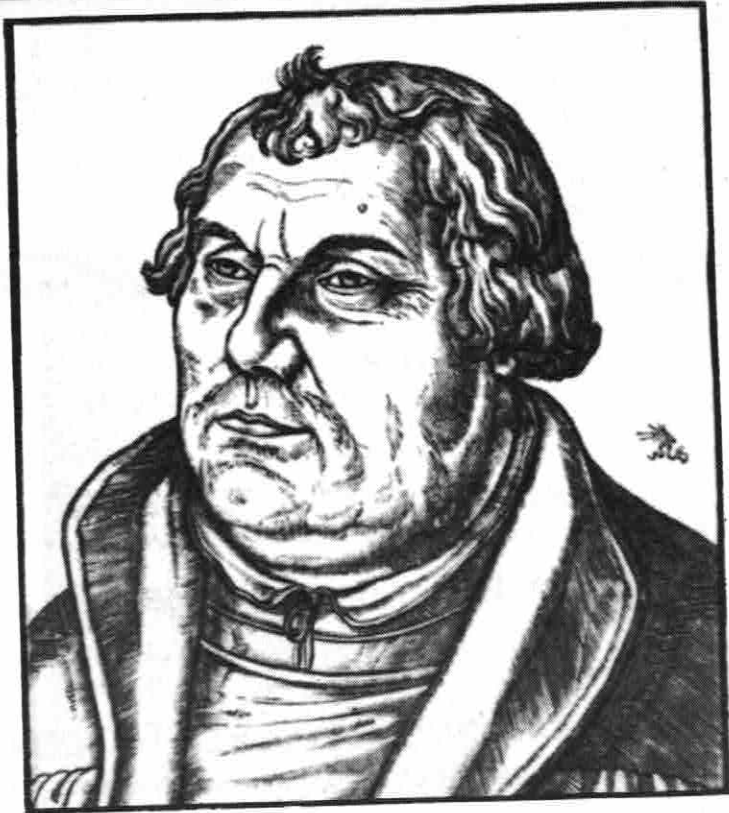
D Martin Luther