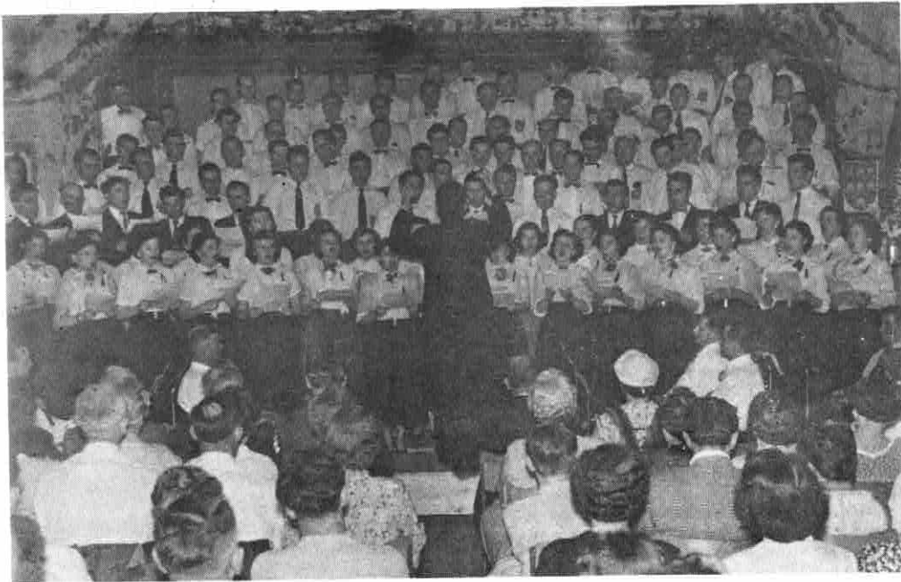
1. SÄNGERFEST am 24. Mai 1955 in der TRANSYLVANIA KLUBHALLE 16 Andrew Street, Kitchener, Ont.