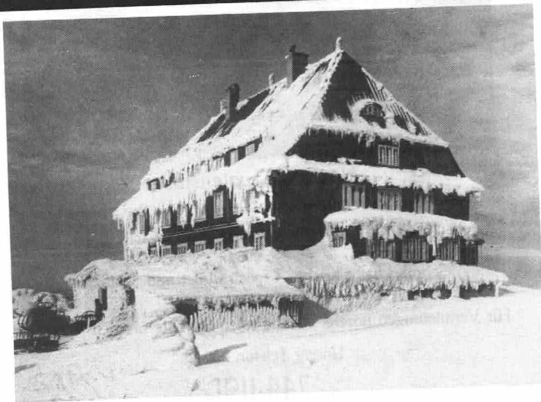
Winter im Riesengebirge