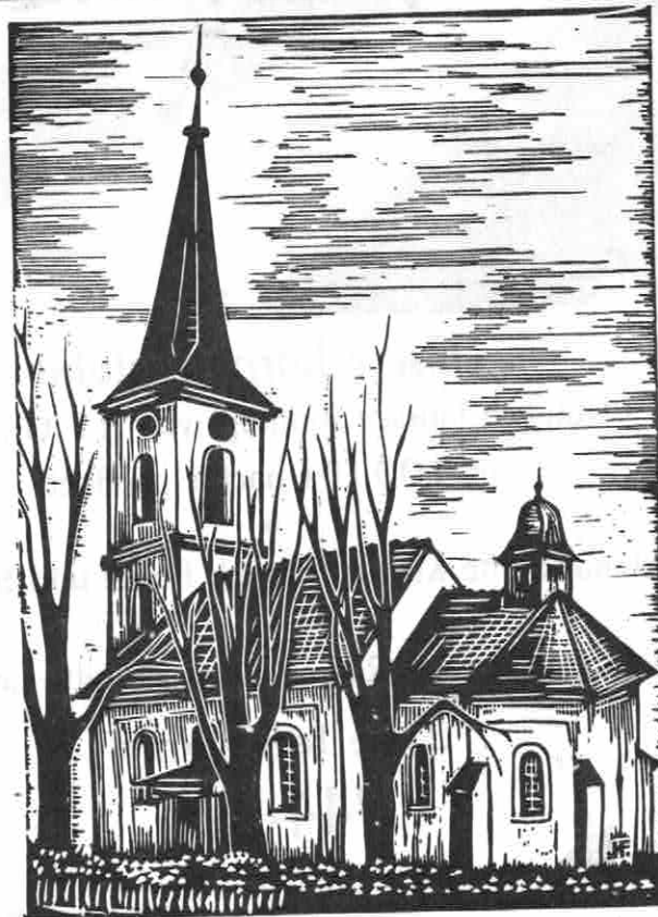
Birker Evangelische Kirche