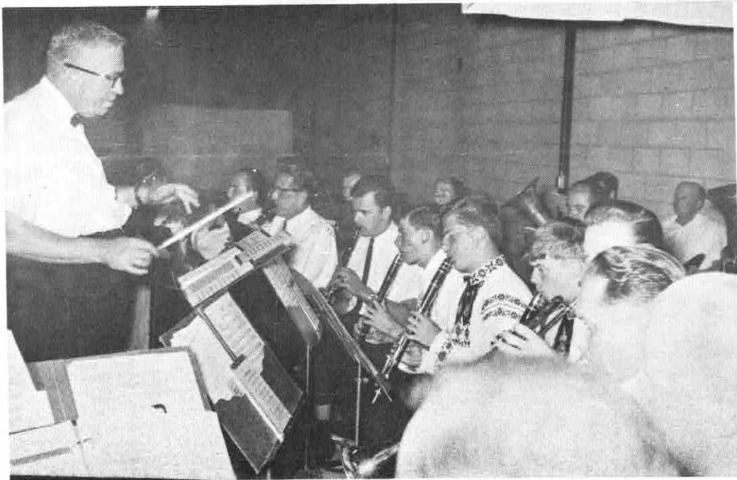
EINE DER LETZTEN AUFNAHMEN DER TRANSSYLVANIA - BLASKAPELLE