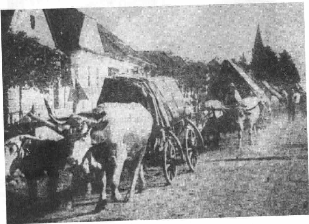
TRECK AUF DER FLUCHT 1944