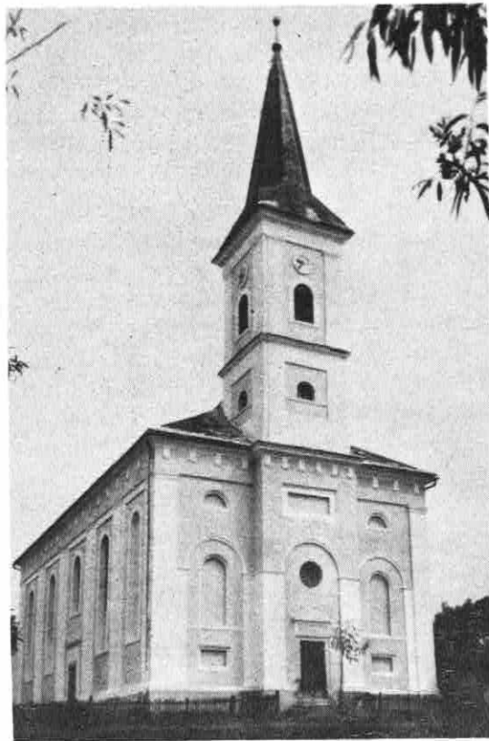
DIE EV. KIRCHE IN OBERNEUDORF Siebenbürgen