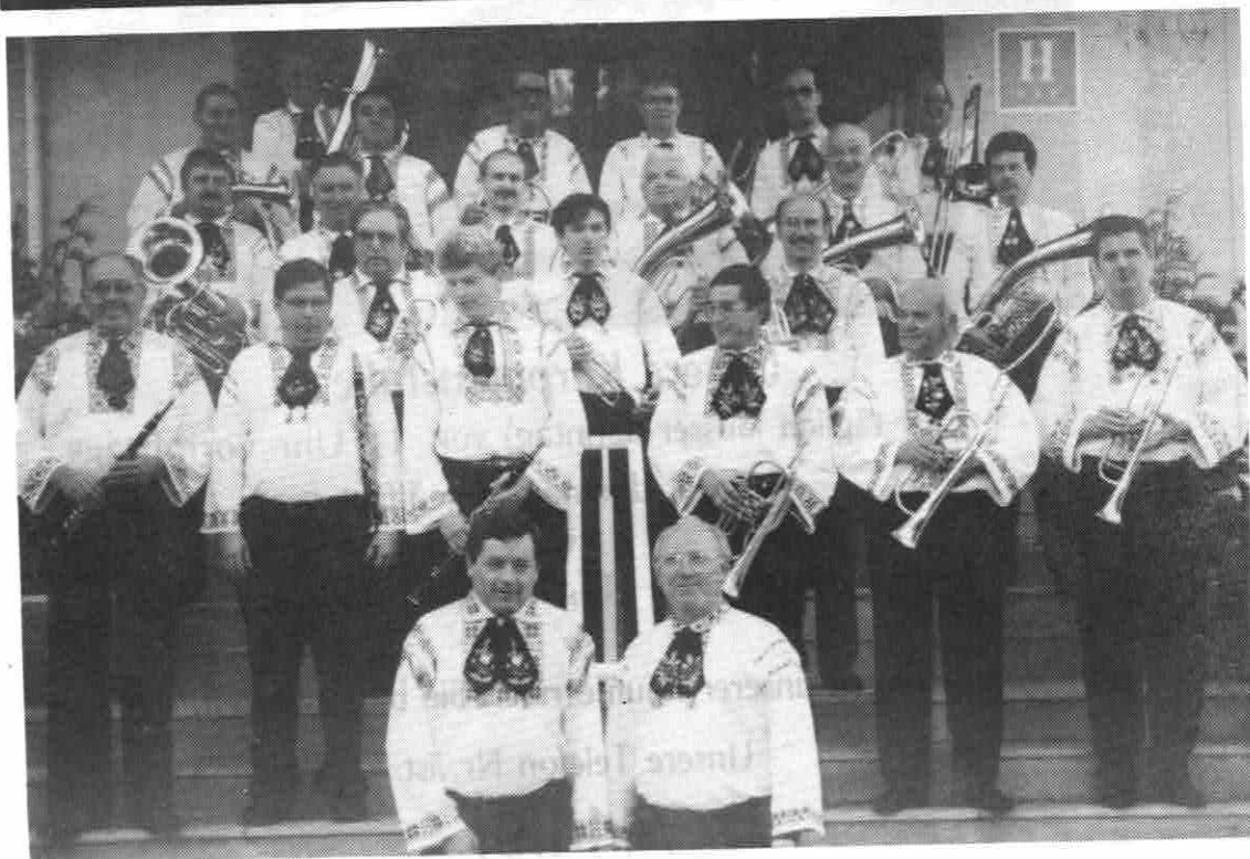
Siebenbürger Blaskapelle STUTTGART