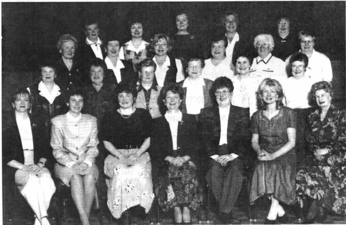
Vorstand des Transylvania Frauenvereins - 1998