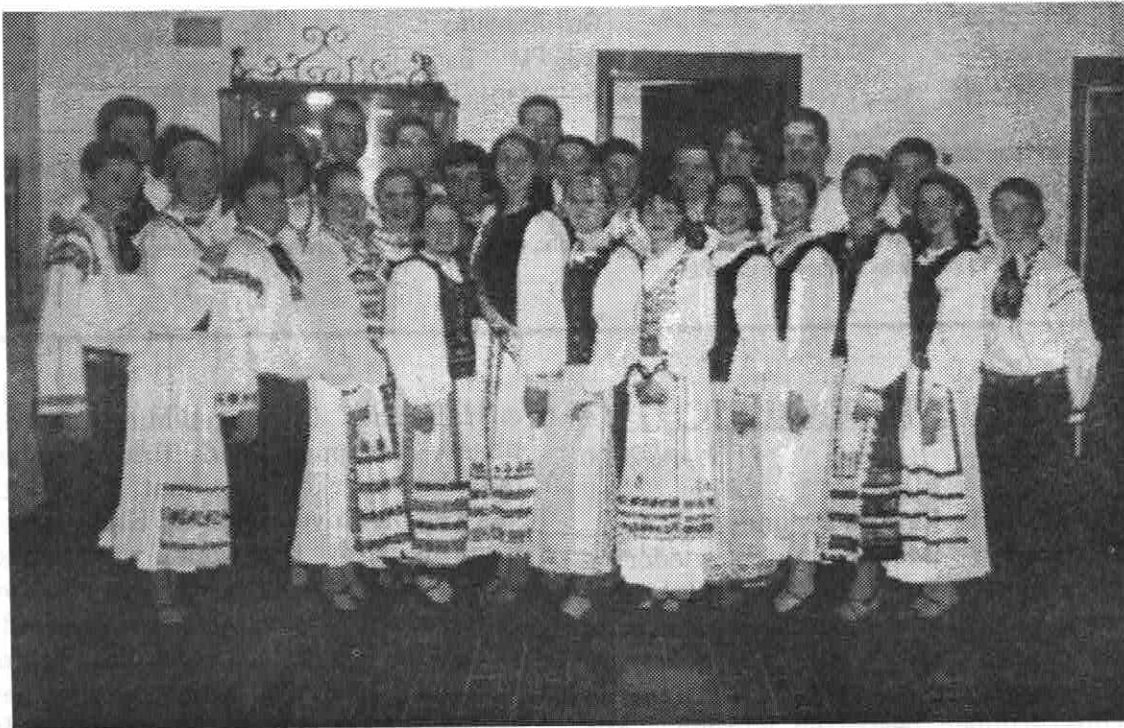
Die Jugendgruppe des Transylvania Klubs im Jahr 2000