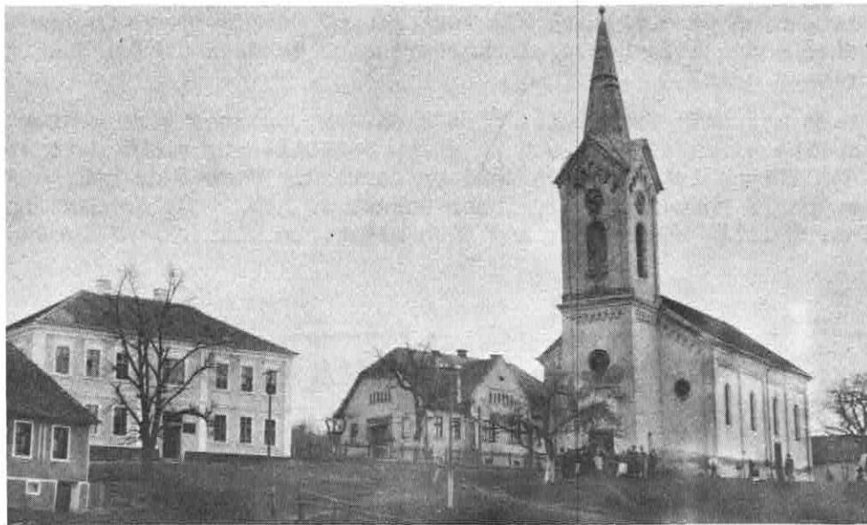
KIRCHE, PFARRHAUS und SCHULE in GROSS - SCHOGEN