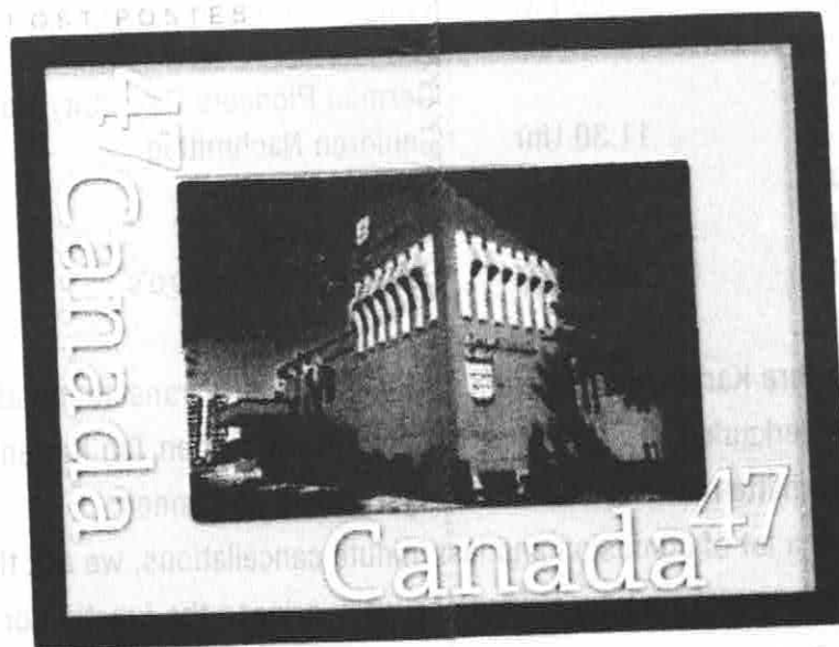
Der Transylvania Klub Kitchener auf Briefmarke