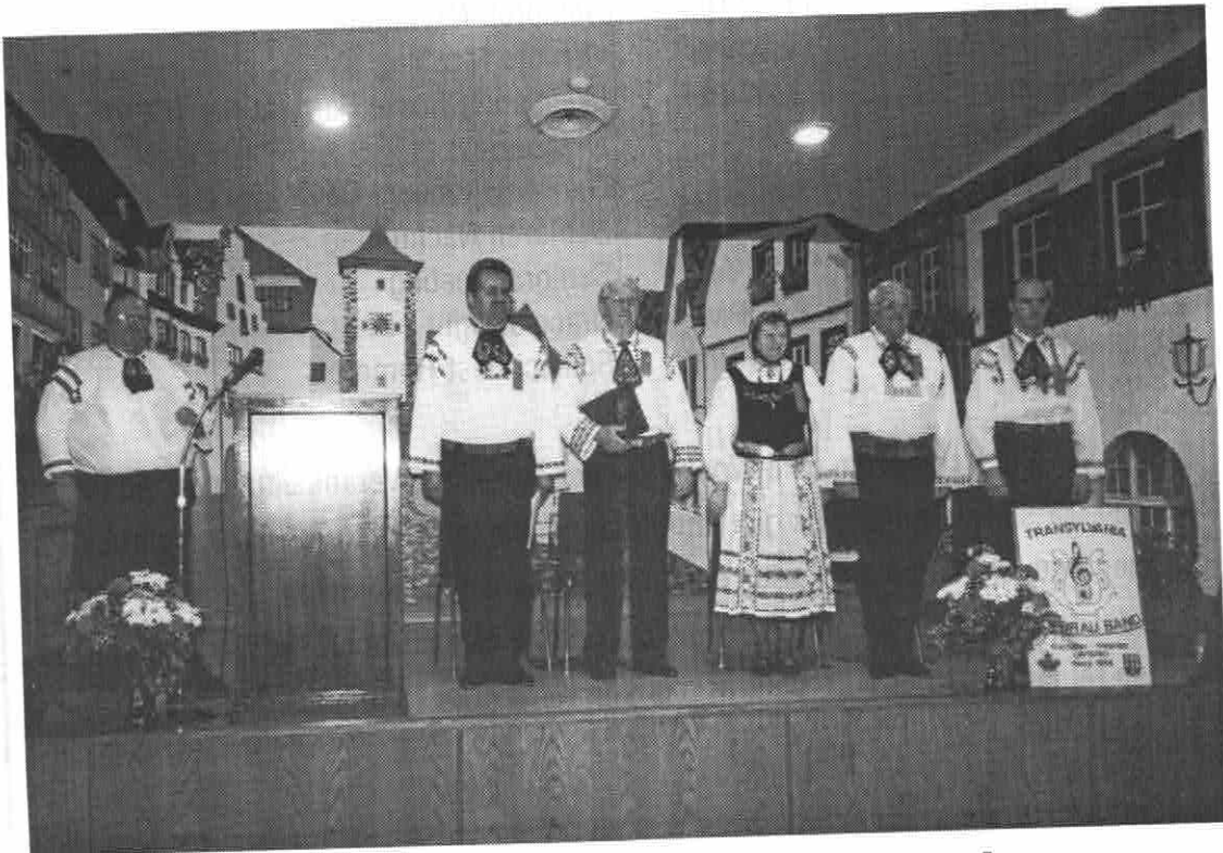
Heimattag 2001 in Windsor, Kanada