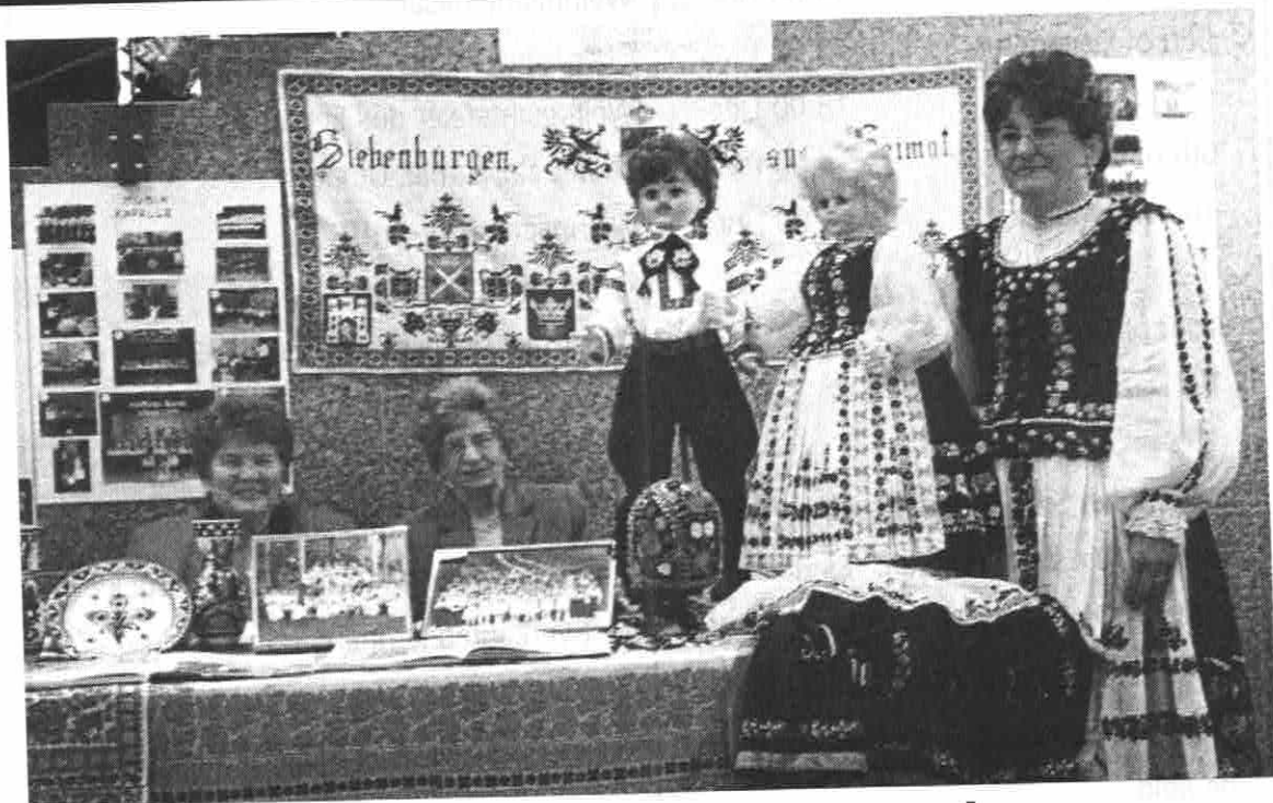
Die Ausstellung des Frauenvereins beim German Pioneers Day