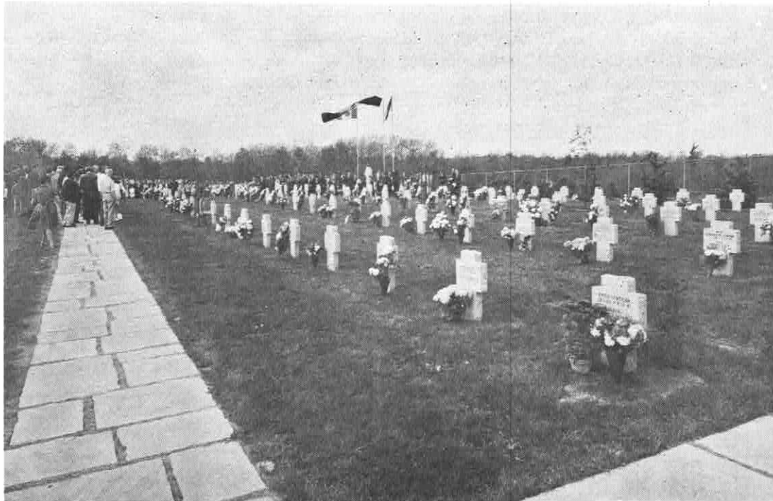
DEUTSCHER SOLDATENFRIEDHOF in KITCHENER, ONTARIO