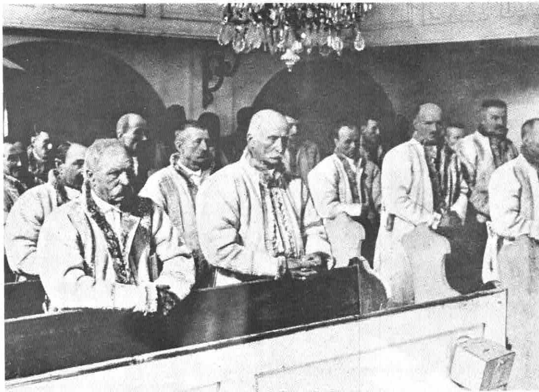
„SIEBENBÜRGISCHE BAUERN IN DER KIRCHE“