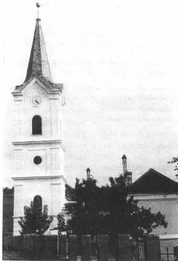
Weilauer Kirchturm neben der Schule