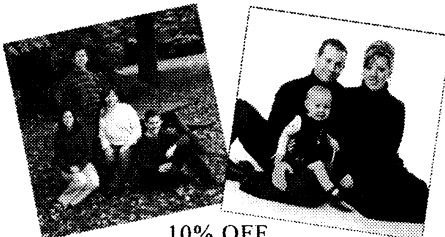
10% OFF Portrait Packages -or- Custom Framing

In order to avoid a lot of confusion and last minute cancellations, we ask that you please remember to pick up your tickets one week prior to the function or they will be sold.