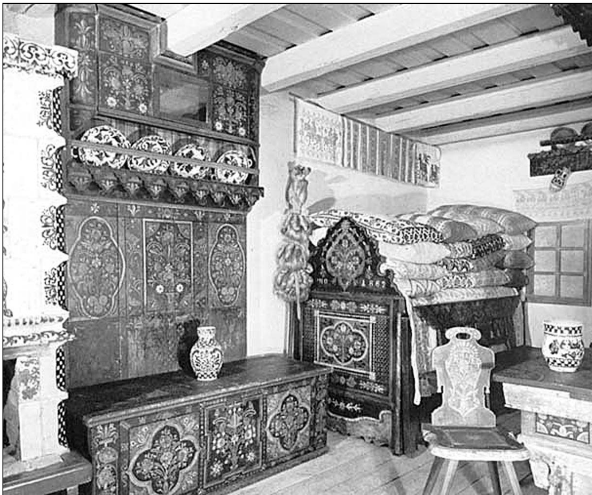
Sächsische Bauernstube. Brukenthal-Museum, Hermannstadt