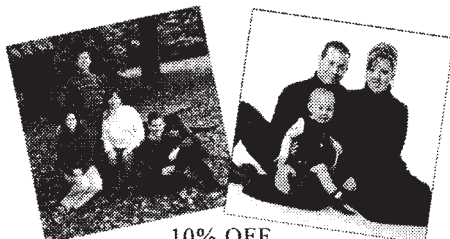
10% OFF Portrait Packages -or- Custom Framing

Please help reduce our function costs by picking up your tickets at our club office at least one week prior to the event. By doing so you will help in our function planning and help reduce our food purchase costs. Tickets not picked up one week in advance may be sold.