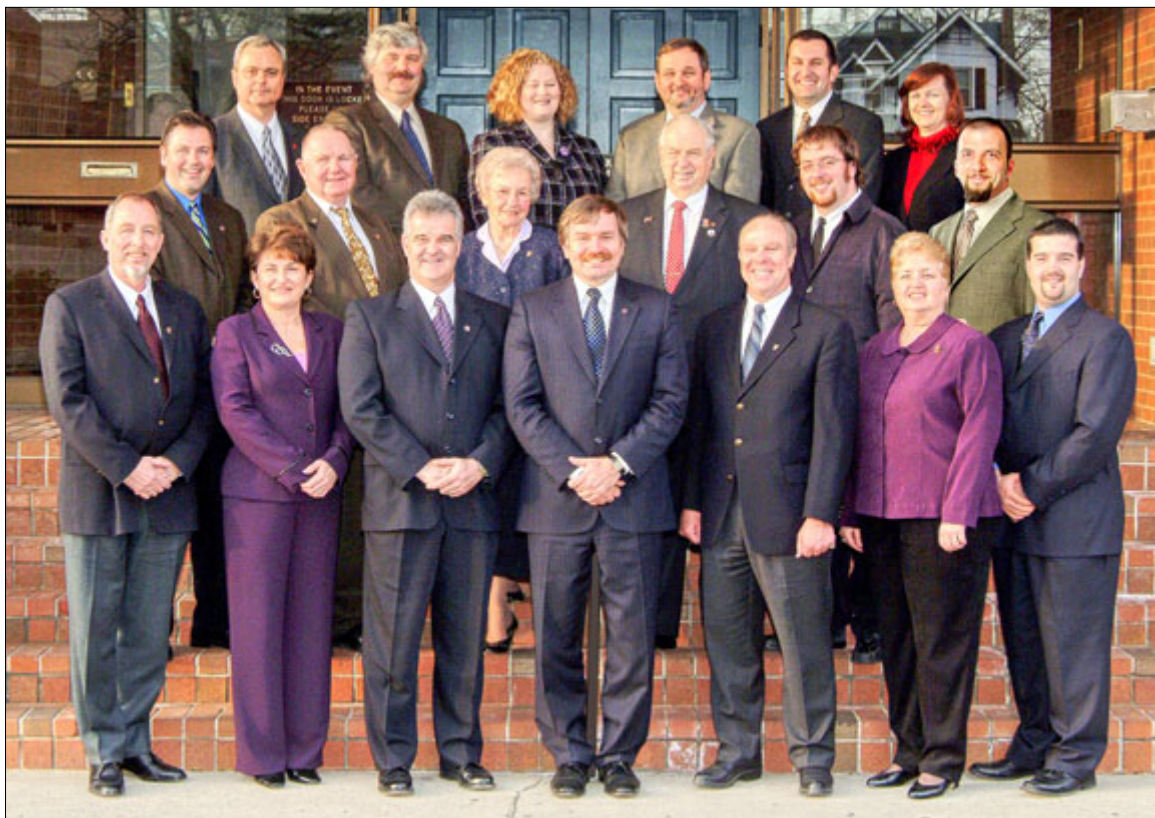
Board of Directors - Vorstand 2006