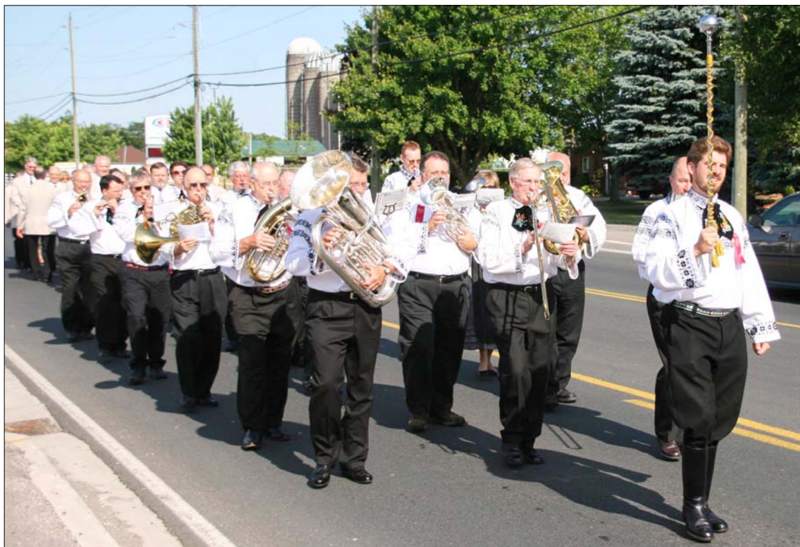
Transylvania Club Brass Band at Heimattag in Aylmer