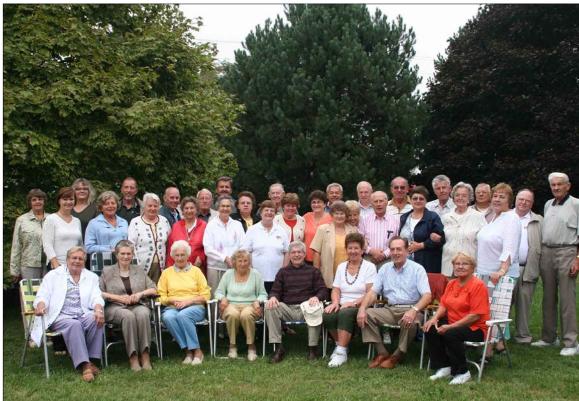
Choir Picnic/Chor Picknick