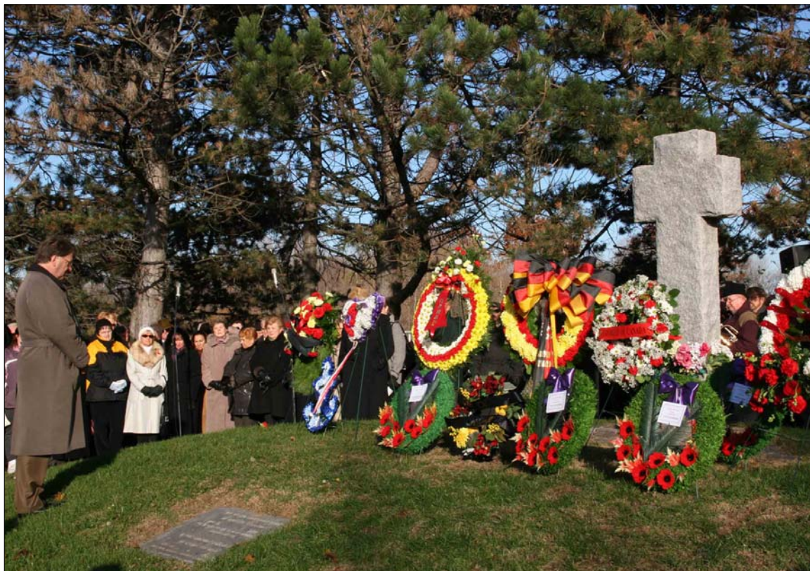
Remembrance Day Ceremony/Volkstrauertag - Woodland Cemetery

Check www.transylvaniacub.com to find our Nachrichtenblatt online.