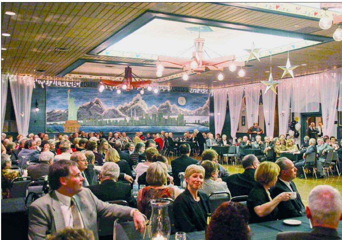
Frauenball - "New York, New York" - 2008

Check www.transylvaniacub.com to read your Nachrichtenblatt online!