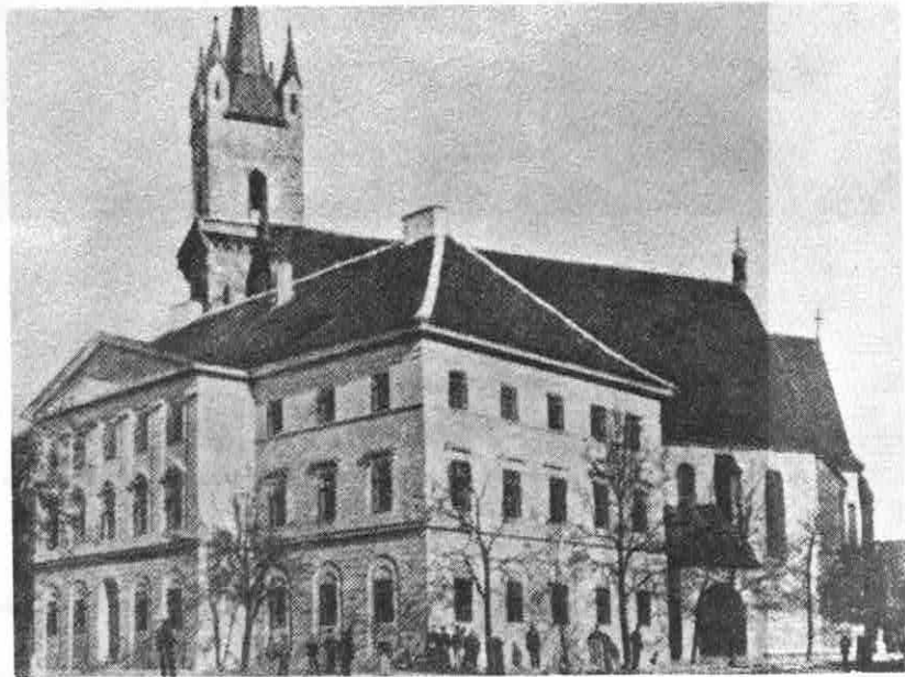
KIRCHE und SCHULE die geistige Kirchenburg der Siebenbürger Sachsen