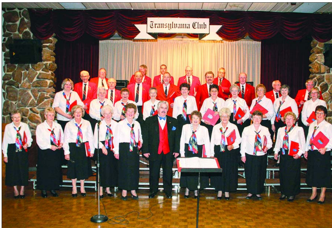
Transylvania Club Choir - Chorabend - 2008

Check www.transylvaniacub.com to read your Nachrichtenblatt online!