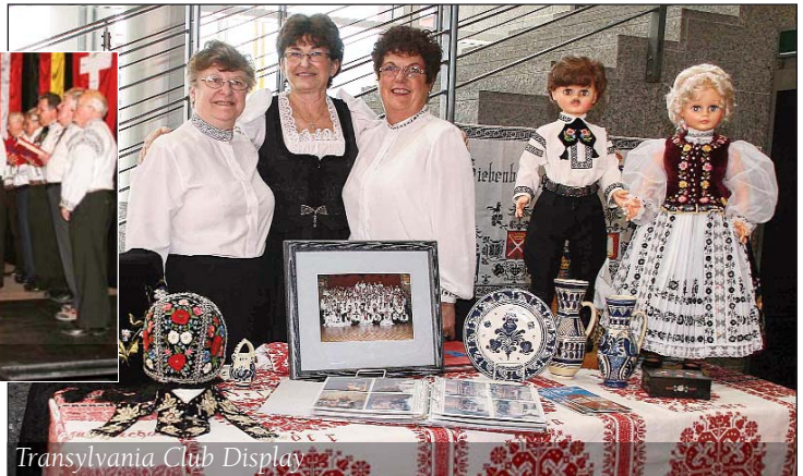
Transylvania Club Display