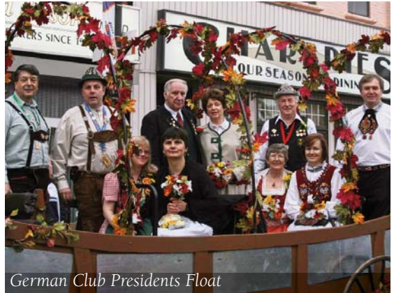
German Club Presidents Float