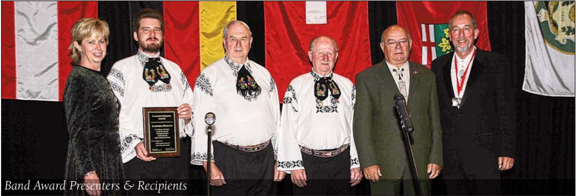
Band Award Presenters & Recipients