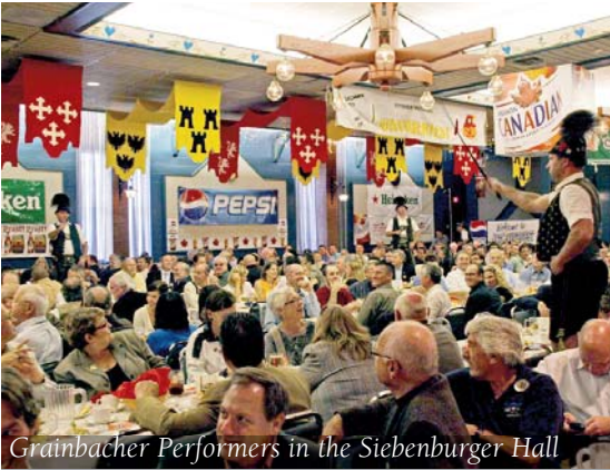
Grainbacher Performers in the Siebenburger Hall