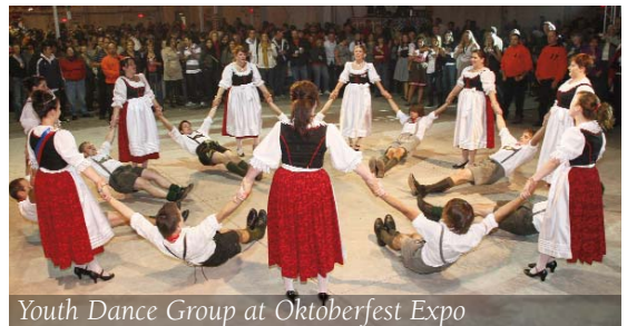
Youth Dance Group at Oktoberfest Expo