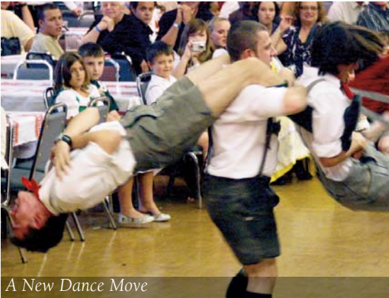
A New Dance Move