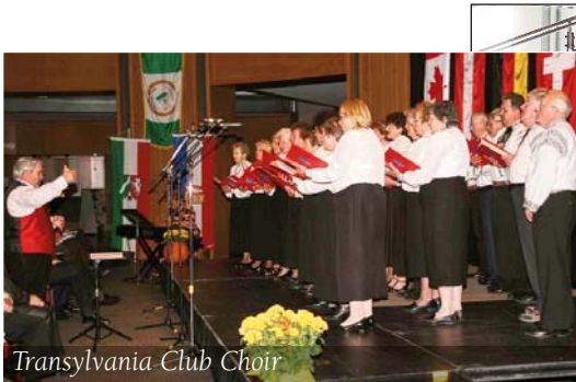
Transylvania Club Choir