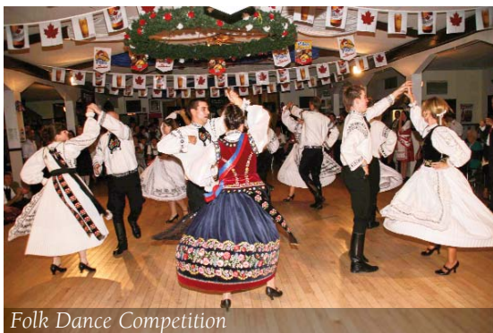
Folk Dance Competition