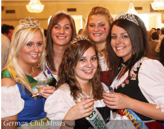
German Club Misses