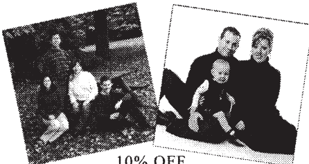
10% OFF Portrait Packages -or- Custom Framing

Forde Studio PHOTOGRAPHERS & PICTURE FRAMERS