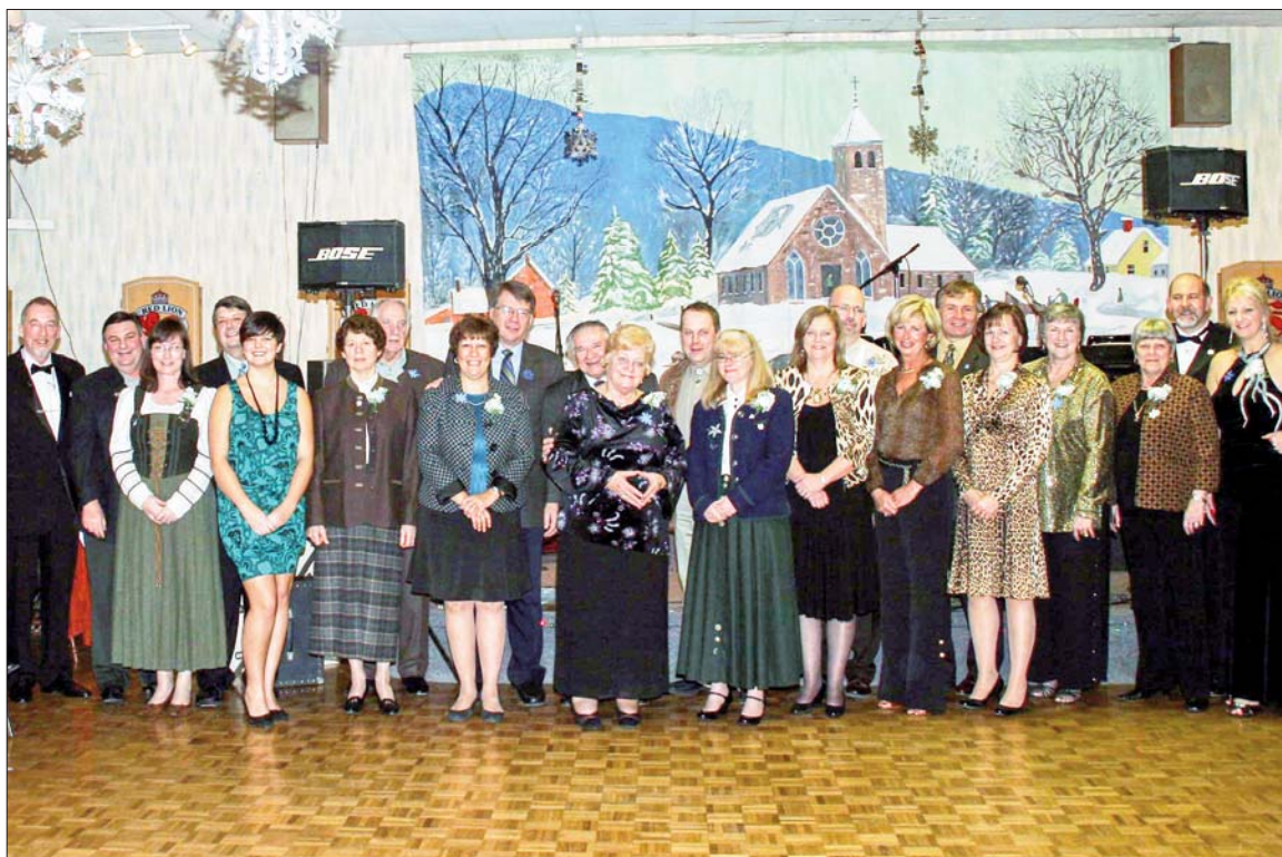
Kameradschaftsabend - 2009