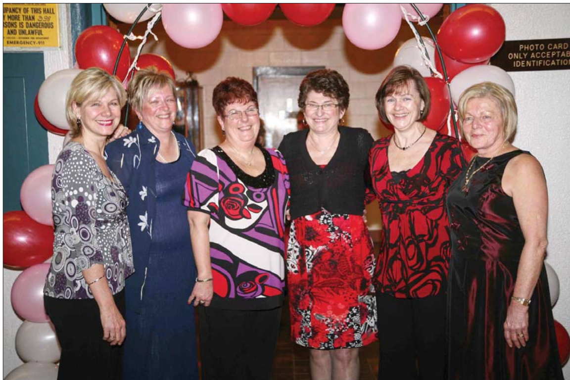
Ladies Auxiliary – Frauenverein – Executive Committee at Frauenball 2009