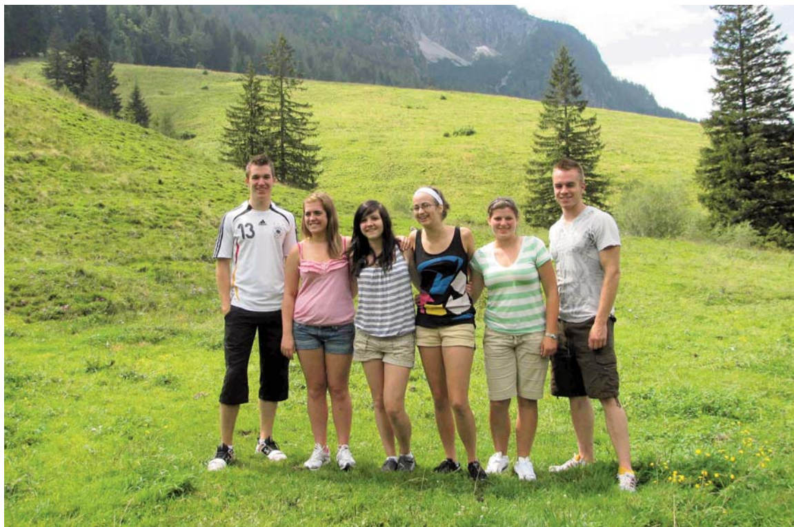
Canadian Jugendlager Participants – Austria – 2009