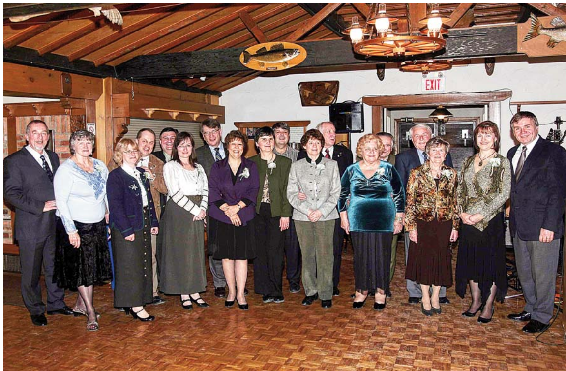
Presidents of the Arbeitsgemeinschaft and German Clubs with their wives at Kameradschaftsabend at the GCHFC