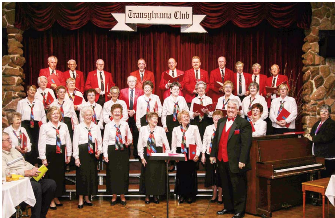
Transylvania Choir - Chorabend 2010