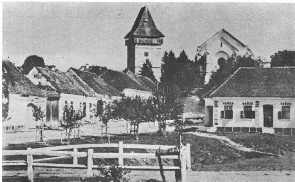
METTERS DORF mit Kirche und „Speckturm“