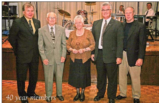
40 year members