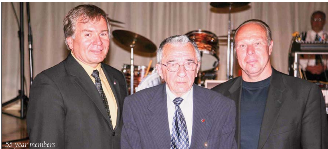
55 year members