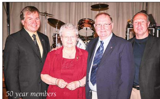
50 year members