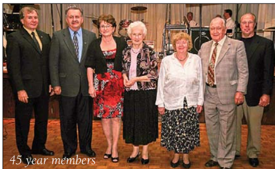
45 year members