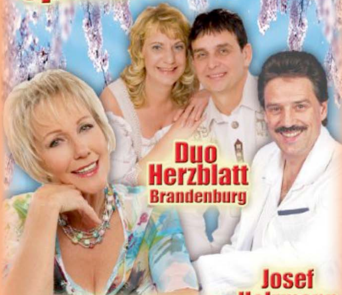
Duo Herzblatt Brandenburg