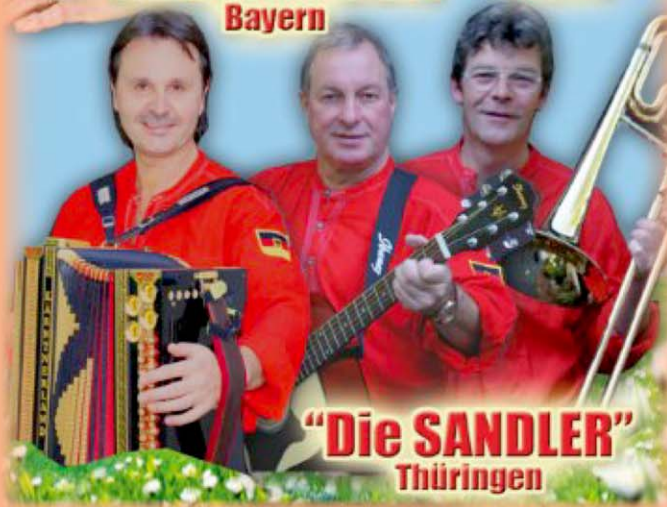
"Die SANDLER" Thüringen

presented by the Schwaben Club & Transylvania Club