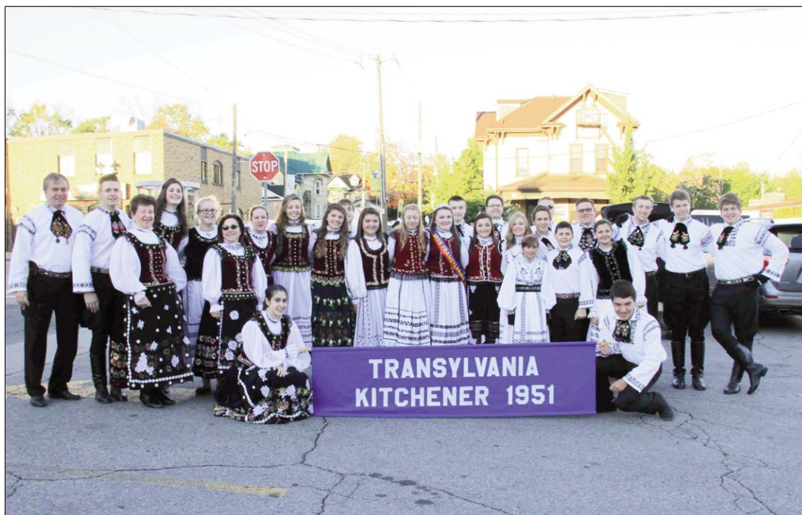
TCK Members in Tracht ready for the K-W Oktoberfest Parade

New Office Hours: Tuesday to Friday – 0900 to 1300