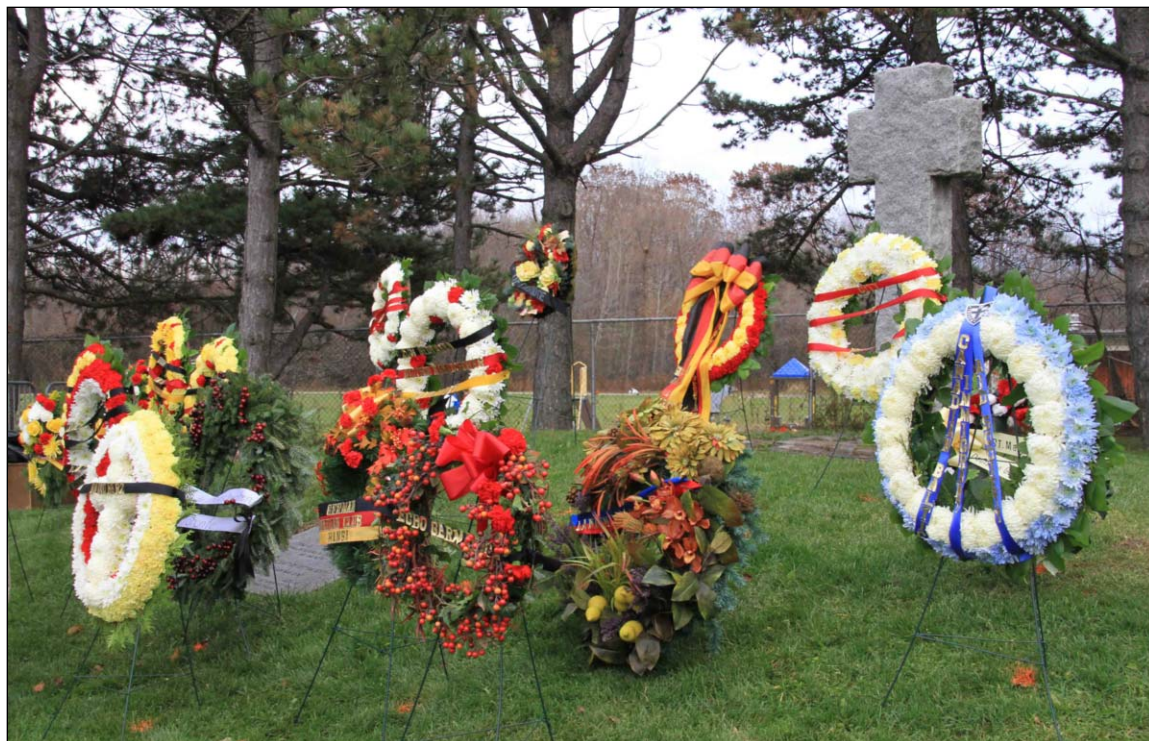
Remembrance Day Ceremony/Volkstrauertag - Woodland Cemetery - 2013

Our Office Hours: Tuesday to Friday – 0900 to 1300