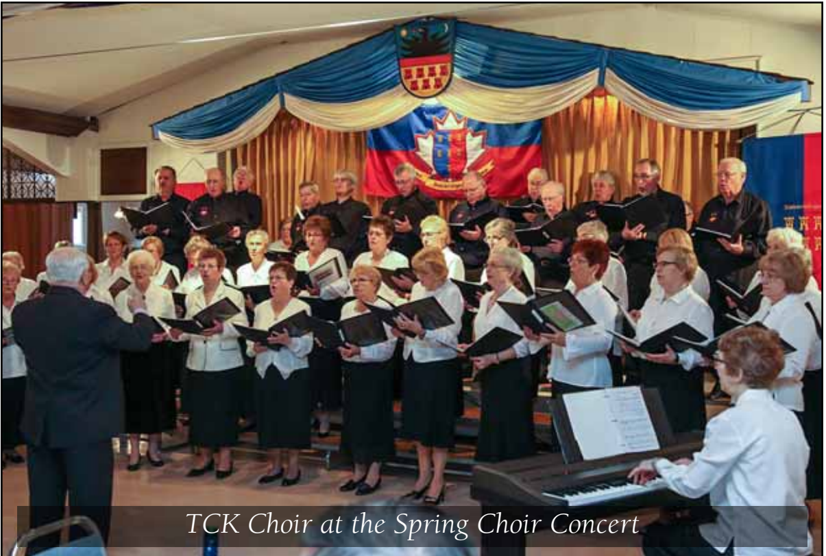
TCK Choir at the Spring Choir Concert

Our Office Hours: Tuesday to Thursday - 09:00 to 13:00