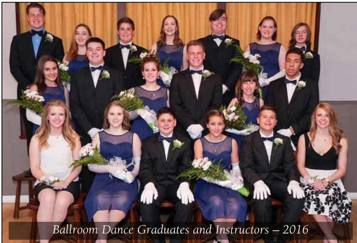
Ballroom Dance Graduates and Instructors – 2016

Our Office Hours: Tuesday to Thursday - 09:00 to 13:00