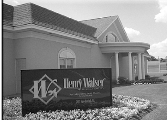
KITCHENER'S ONLY INDEPENDENTLY FAMILY OWNED FUNERAL HOME.