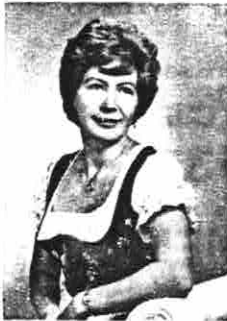
" SCHATZI "

TELEPHONE 576-6950 LICENCED MECHANIC - TIRES - BATTERIES