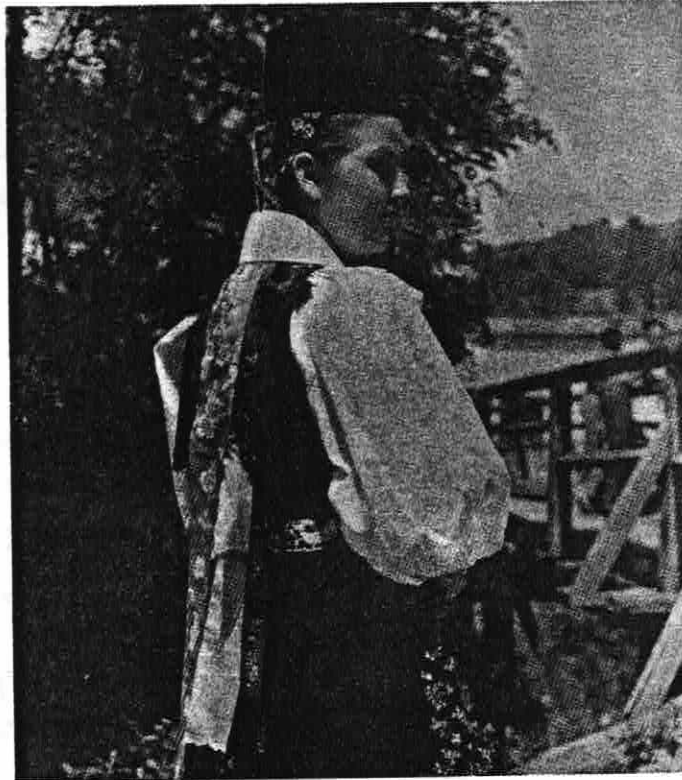
MÄDCHEN AUS STOLZENBURG in Sonntagstracht