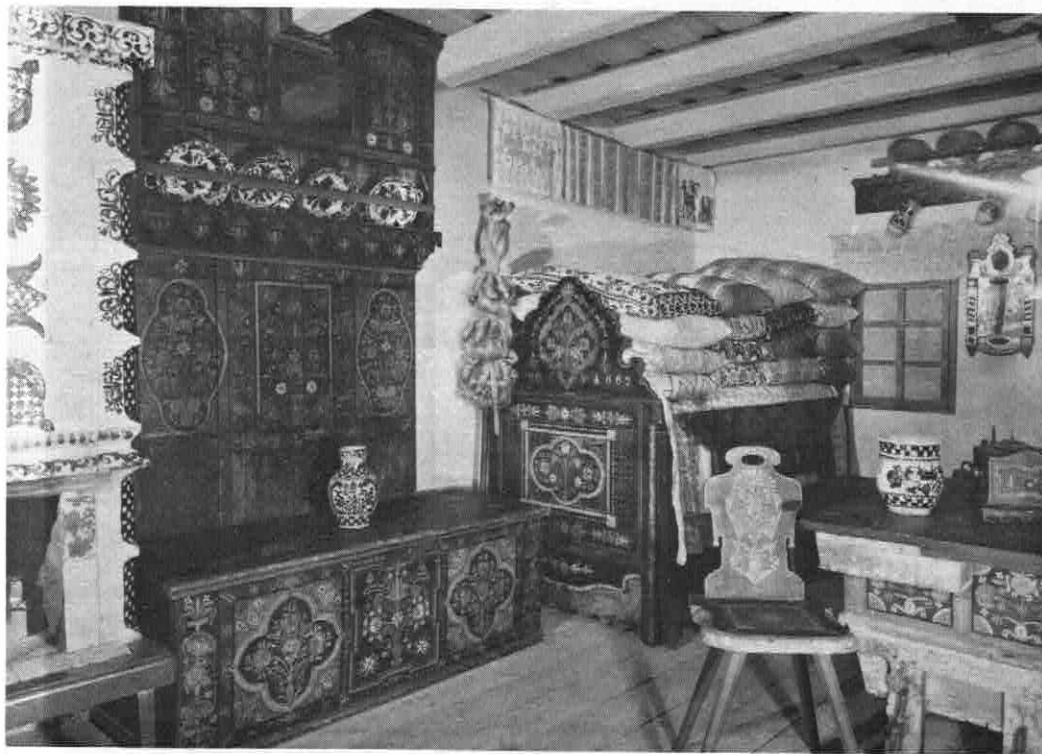
SIEBENBÜRGISCH - SÄCHSISCHE BAUERNSTUBE