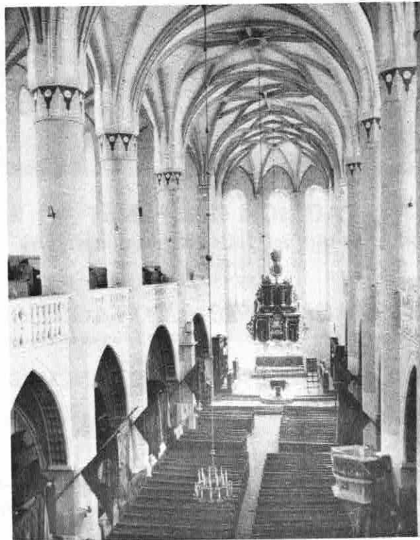
STADTPFARRKIRCHE IN BISTRITZ